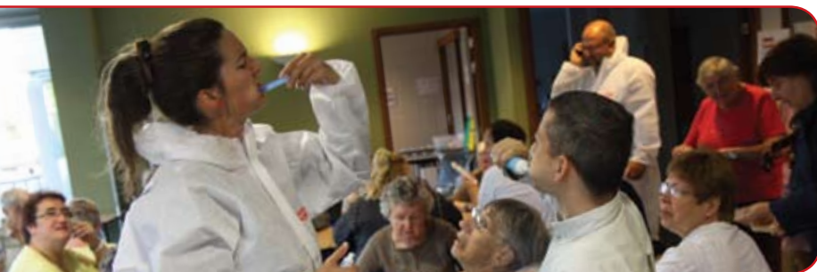
Tanden poetsen > lees p.4