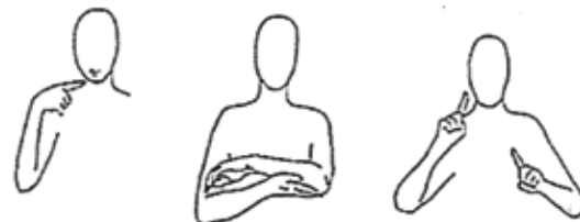
Spreken met Ondersteuning van Gebaren

Concrete informatie en inschrijvingsmodaliteiten voor deze laatstgenoemde vorming kan u vanaf januari bekomen via een mailtje naar: elsverlinden@zonnestraalvzw.be