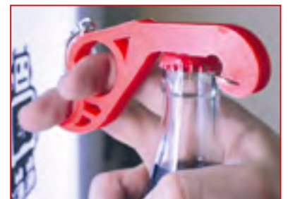
Voorbeeld van hulpmiddel

Een 3D-geprinte winnaar-trofee, voor de vijfkamp op 14 juni 2020. Herken je ons vijfkamplogo er in? :-)